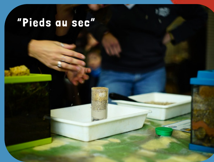
"Pieds au sec"