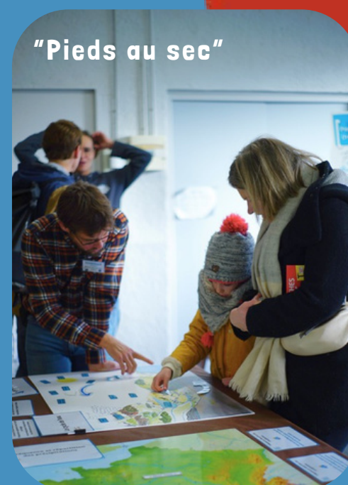
"Pieds au sec"