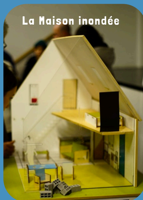
La Maison inondée