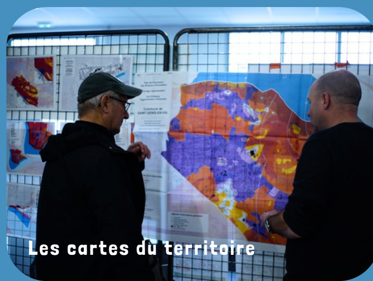
Les cartes du territoire