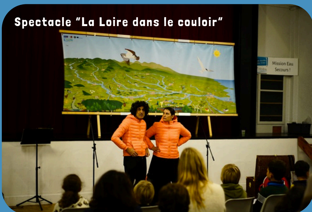
Spectacle "La Loire dans le couloir"