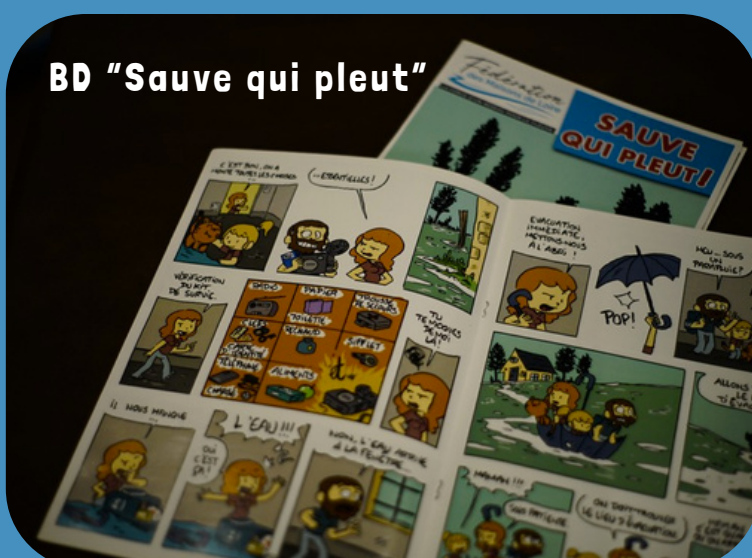
BD "Sauve qui pleut"